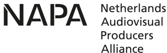
NAPA - Netherlands Audiovisual Producers Alliance - The Netherlands