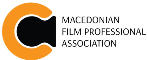
Macedonian Film Professional Association – North Macedonia