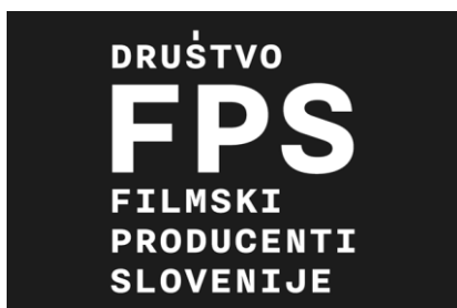
Association of Slovenian Producers – Slovenia